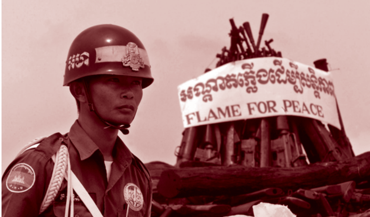
Un policía se detiene frente a una pila de aproximadamente 7.000 armas (incluyendo armas pequeñas) en la provincia de Kampong Cham, al norte de Phnom Penh, julio de 2001. Las autoridades de Camboya encienden una enorme hoguera para destruir varias armas como parte de las iniciativas actuales para eliminar las armas ilícitas que circulan en ese país.

Sin embargo, las ONG y el Representante Especial del Secretario General de las Naciones Unidas para los Derechos Humanos en Camboya han resaltado algunos problemas relacionados con la competencia, profesionalismo e integridad de los cuerpos de seguridad y las reglas de enfrentamiento de la policía. Un estudio realizado por la WGWR demuestra que la policía, la milicia y los soldados se ubican en los primeros puestos de la clasificación 'susceptibles de utilizar un arma para lograr lo que desean'.