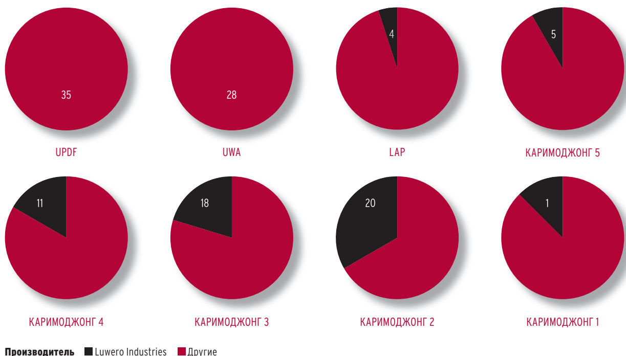
Рисунок 9.5. Наличие боеприпасов калибра 7.62 x 39 мм производства Luwero Industries (Уганда) у различных группировок в Карамодже (доли запасов каждой группировки)

Примечание: Цифры на круглых диаграммах означают количество патронов у отдельных боевиков указанных группировок.