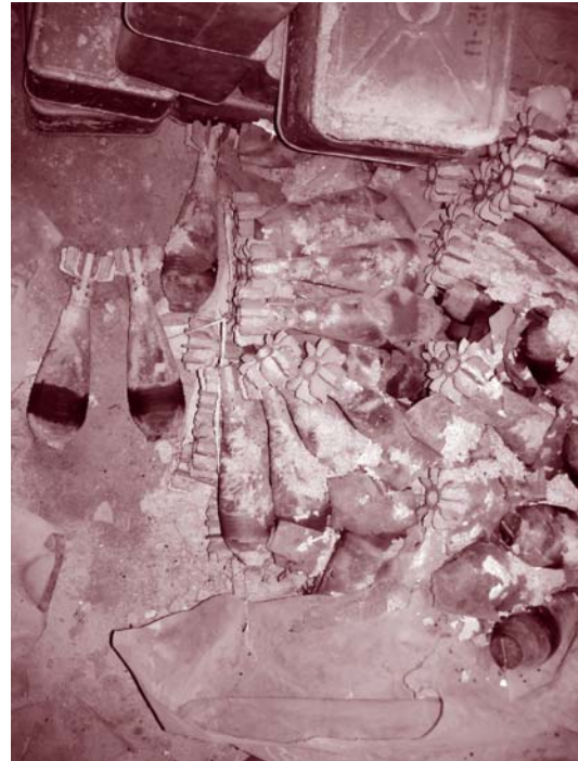
图例：索马里普特南的军火库。2009年地雷咨询组织帮助其销毁了军火库中的军火。2007年“日内瓦号召”

在最近与武装组织进行的人道主义交涉中取得的成就已使分析家和政策制定者开始号召考察在小武器问题上与武装组织接触的可能性。这些对话将致力于保证武装组织使用、存储和管理小武器的方式与国际人道主义法、国际人权法以及其它适用标准保持一致。