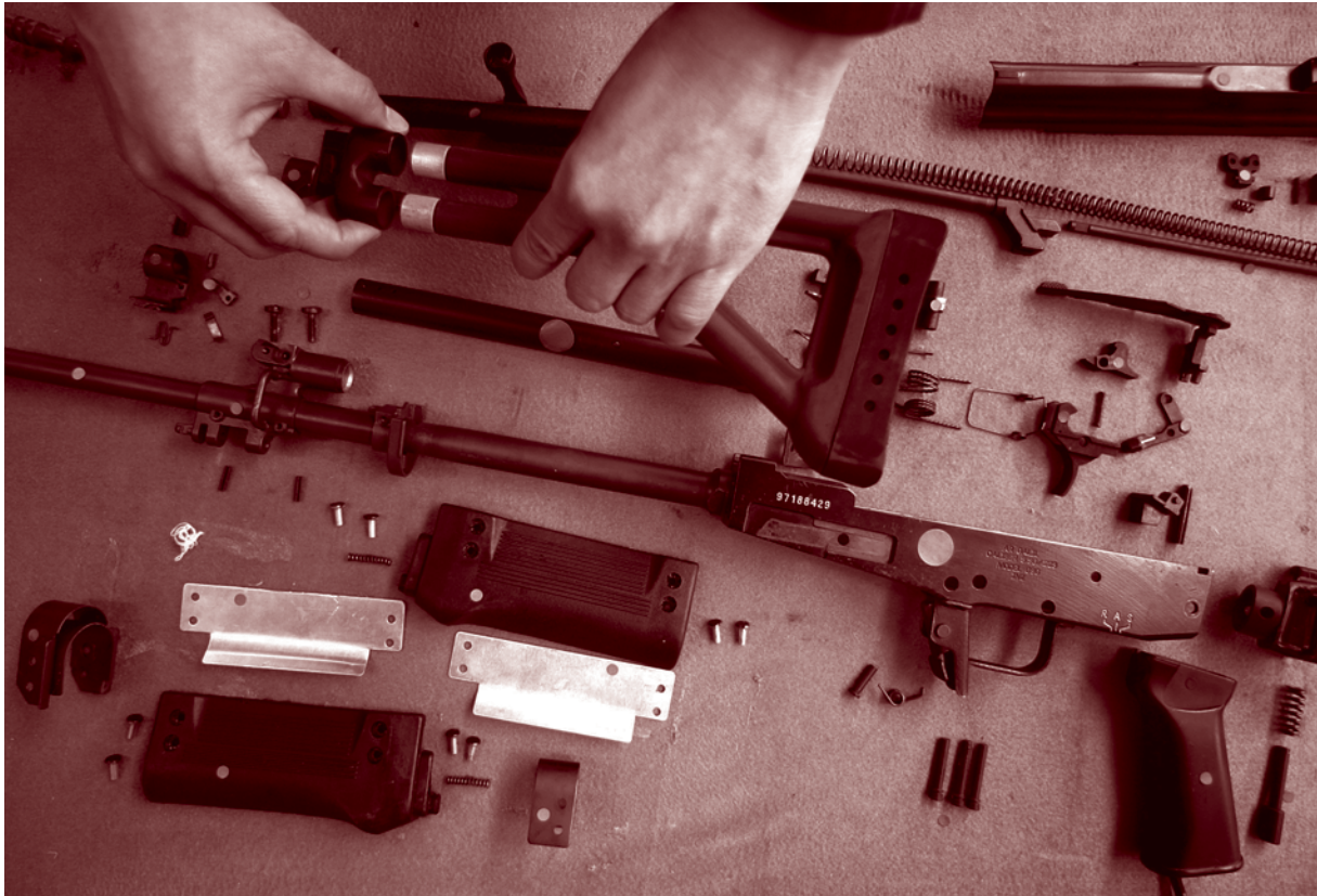
Un employé d'INDUMIL (Industria Militar), un fabricant d'armes colombien, expose les différentes pièces d'un fusil d'assaut, mai 2006.