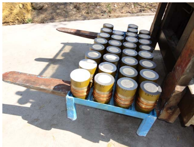
Visokoeksplzivni projektili se obrađuju pomoću industrijske trakaste testere (levo) i otvorene čaure kao proizvod obrade se transportuju radi uklanjanja energetskog materijala (desno).