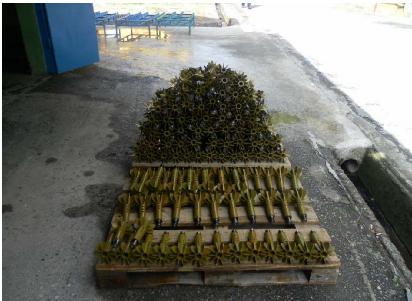
Repovi minobacača od 120 mm u fabrici ULP Mjebes u Albaniji

Kompanije za demilitarizaciju ne mogu posedovati municiju sve dok ne dobiju sertifikat o uništenju. Na primer, izjava o radu organizacije NAMSA navodi da državne oružane snage ostaju vlasnici municije u skladu sa državnim propisima. Prvobitni vlasnik