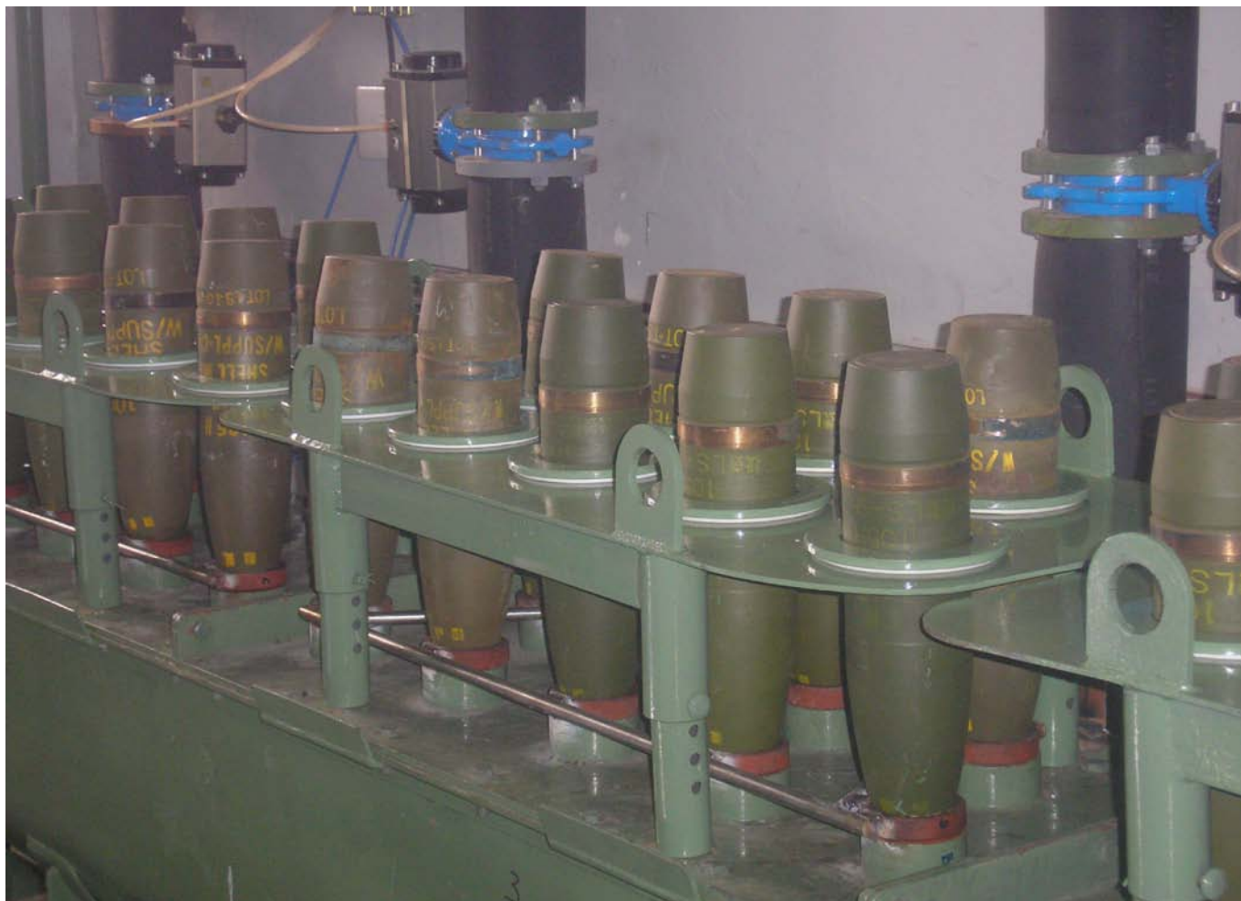
Ispuštanje projektila punjenih TNT-om.

demilitarizacijom – jedna strana zagovara profesionalno sprovedene tehnike OB/OD kao veoma uspešan proces sa zanemarljivim uticajem na životnu sredinu. Tehnika OB/OD je i dalje jedino praktično i pragmatično rešenje kada su zalihe previše opasne za pomeranje ili ukoliko je potrebno ostvariti malu ekonomiju obima u okviru nacionalnih zaliha. Većina naoružanih snaga, uključujući snage u okviru NATO-a, žele da zadrže tehniku OB/OD kao važeću institucionalnu metodu odlaganja municije i eksploziva. Ekološkim uticajem se može upravljati ako se pažljivo odabere lokacija i materijal za uništavanje i ako se neprestano prati sadržaj ispušten sa lokacija za uništavanje koji odlazi u vazduh, zemlju i vodu. Sadržaj ispušten u lokalno zemljište nakon primene tehnike OD često može da se smanji ili zaustavi zaptivanjem zemljišta kako bi se zaustavilo slivanje vode ili