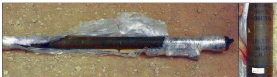
SA-7b projektil pronađen u tajnom skladištu oružja u Iraku, u septembru 2008. Oznake na cevi lansera pokazuju da je proizveden 1978.

MANPADS su pravljeni da budu funkcionalni u dugom vremenskom periodu. Vek trajanja od deset ili čak dvadeset godina nije neuobičajen. Prema određenim izvorima, dva MANPADS SA-7b, iskorišćena u napadu na izraelski avion u novembru 2002. u Mombasi, Kenija, sadržala su kritične komponente proizvedene 70-ih godina (vidi npr. Ujedinjene Nacije, 2003, str. 29–30; Richardson, 2003) (Vidi tabelu 1 na strani 2, u kojoj su dati primeri korišćenja MANPADS sistema za napad na civilni avion). Uslovi skladištenja mogu uticati na vek trajanja sistema. 6