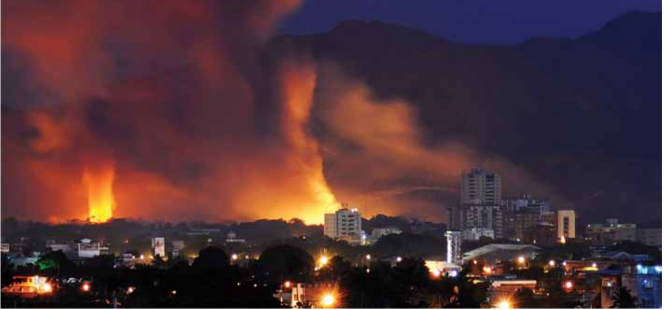
يقال إن حريقاً شب في ماراكاي، فنزويلا، بتاريخ ٣٠ يناير ٢٠١١ كان سببه انفجار مستودع ذخائر مدفعية تابع للجيش الفنزويلي أسفر عن مقتل شخص واحد وأجبر على إخلاء ١٠,٠٠٠ من سكان المناطق المحيطة.

ذلك بكثير. في يناير ٢٠٠٢، على سبيل المثال، أدت سلسلة من الانفجارات التي وقعت في مستودع عسكري على مشارف لاغوس، نيجيريا، المدينة الأكثر اكتظاظاً بالسكان في شبه الصحراء الإفريقية، إلى أكثر من ١١٠٠ حالة وفاة، مع تعرض الكثير من الناس للفرق في القنوات المجاورة عندما كانوا يفرون من النيران والانفجارات (MSIAC، ٢٠٠٢). انظر أيضا USDos (٢٠١٠) و IFRC (٢٠١٠). ٣. بعد انفجار وقع في براشين، صربيا، في عام ٢٠٠٦ ذكرت المصادر انسداد طريق المدخل الرئيسي لمدة ٣٢ ساعة، مما أدى إلى خسارة ما تقدر قيمته ١٥ مليون يورو (١٩ مليون دولار) من التجارة (المنتدى البرلماني، ٢٠٠٨). وأزال الجيش الصربي لاحقاً أكثر من ١٣٠,٠٠٠ قطعة من الذخائر غير المنفجرة من محيط ٨ كم ٢ حول المنطقة الملوثة (يوفانوفيتش، ٢٠١١). ٤. مسح الأسلحة الصغيرة (٢٠١٤) بالبناء على قائمة بالحوادث قام بتجميعها أدريان