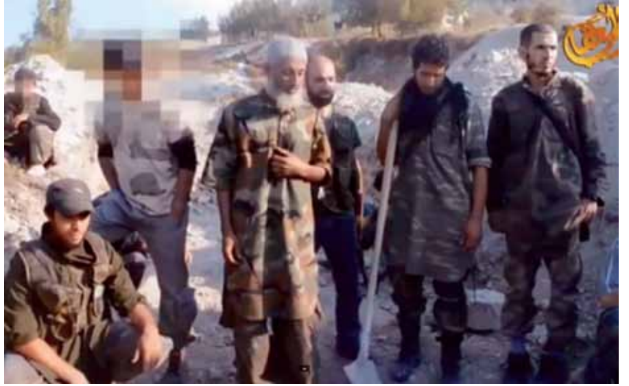
ابراهيم بن شقرون، الجهادي المغربي المعروف مؤسس حركة شمس الإسلام راثياً شريكه المؤسس محمد العلمي السليمانى.

وقد تنوعت أساليب تجنيد المقاتلين المغاربة من الأساليب "التقليدية" إلى الأساليب الحديثة. ٣٤ وتعتمد الأساليب التقليدية على العلاقات الشخصية