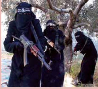
نساء مقاتلات من "لواء الخنساء"، قرب مدينة الرقة في سوريا.

وكذلك هناك أدلة عن وجود نساء يذهبن مع أزواجهن وعائلاتهن للانضمام لتنظيم الدولة الإسلامية. ويكون لهؤلاء النساء قدوة يقتدين بها، مثل الناشطة المغربية السلفية الأكثر تأثيراً فتيحة الحسني، والتي تعرف بأدم المجاطي أو "أرملة القاعدة السوداء". وأم أدم المجاطي كانت زوجة المقاتل المغربي المعروف كريم المجاطي الذي قُتل في المملكة العربية السعودية في العام ٢٠٠٤ أثناء اشتباك بين القاعدة وقوات الحكومة السعودية. وقد عاشت المجاطي مع زوجها في أفغانستان تحت حكم أسامة بن لادن في العام ٢٠٠١ ثم انتقلت إلى باكستان (ربما في بدايات العام ٢٠٠٢) ومن ثم إلى المملكة العربية السعودية. وعلى الرغم من سجنها ومراقبتها مراقبة دقيقة (بعد إطلاق سراحها)، فقد تمكنت الحسني من التوجه إلى العراق، ويقال بأنها مخطوبة أو متزوجة من مساعد البغدادي، الرجل القيادي الثاني في تنظيم داعش (Benhadad, 2014d).