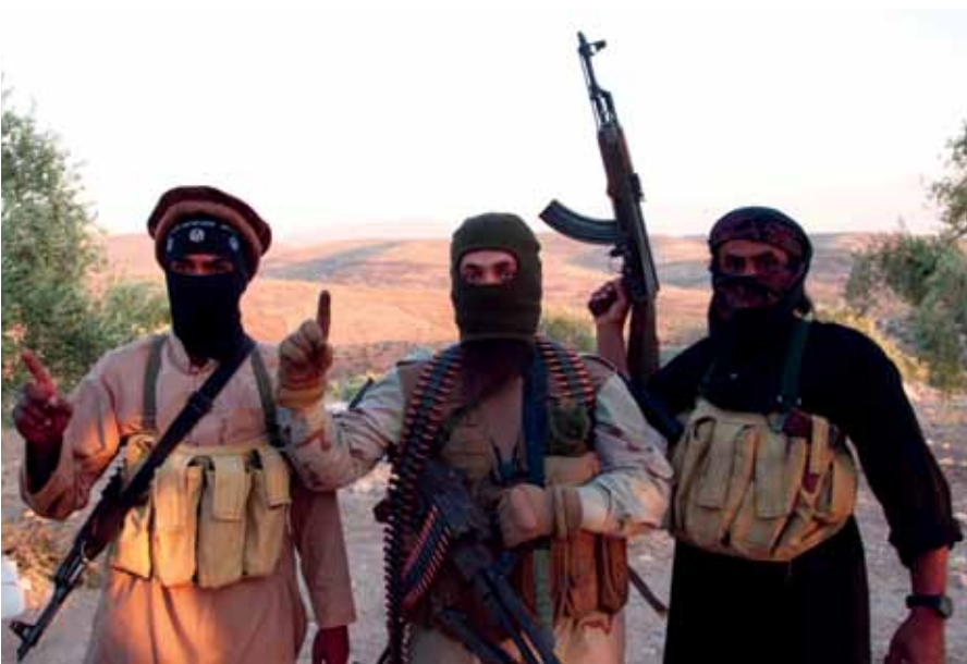
مقاتلو جبهة النصرة خارج مدينة حلب السورية.