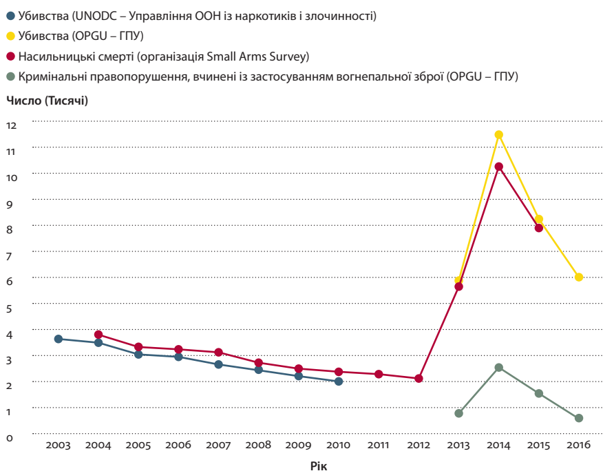
Рисунок 3 Випадки насильницької смерті й кримінальні правопорушення, вчинені з використанням вогнепальної зброї в Україні, 2003–2016 рр.

Примітка: Випадки насильницької смерті включають як убивства, так і загибелі внаслідок конфлікту.