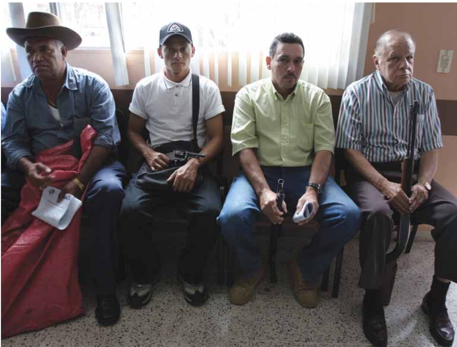
Personas haciendo cola para inscribir sus armas de fuego en el Registro Balístico de Tegucigalpa, Honduras, durante el último día habilitado al efecto, agosto de 2005. Según la Dirección General de Investigaciones Criminales (DGIC), en Honduras hay 140.000 armas registradas.

Por regla general, los observadores no sólo quieren saber cuántas armas en manos de civiles hay en un país, sino