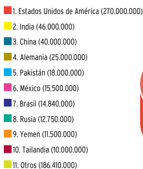
Figura 2 Estimación de las armas de fuego en manos de civiles: los diez primeros países por el total