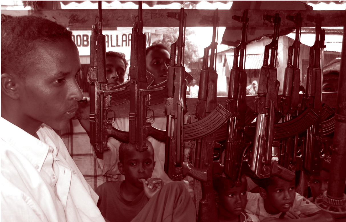
Торговец оружием, который начал свою деятельность в возрасте десяти лет на рынке Бакара, Могадишо, Сомали, июнь 2006.